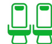
FILAS DE DOS ASIENTOS

Operativa diaria entre Madrid y Canarias (LPA & TFN): 16 vuelos diarios