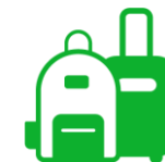
EQUIPAJE Y BOLSO DE MANO