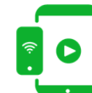
ENTRETENIMIENTO A BORDO