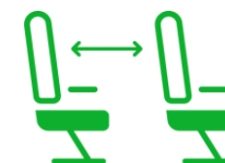
MÁS ESPACIO ENTRE ASIENTOS